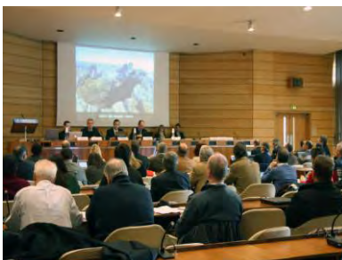
Geo & EGN/GGN

“Le rocce e gli alberi ti insegneranno cose che nessun maestro ti dirà”