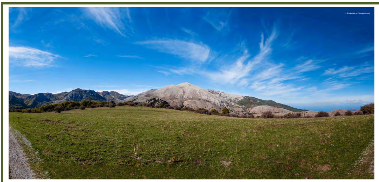
Il Parco delle Madonie, European & Global Geopark con il supporto dell'UNESCO