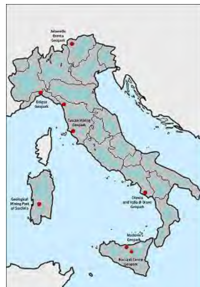
I Geoparchi in Italia