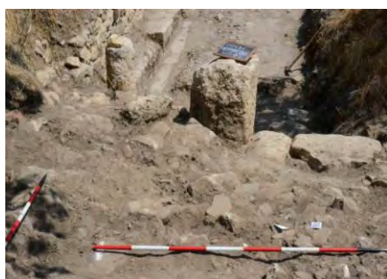
Geo & Cultura

(European & Global Geopark, con il supporto dell'UNESCO)