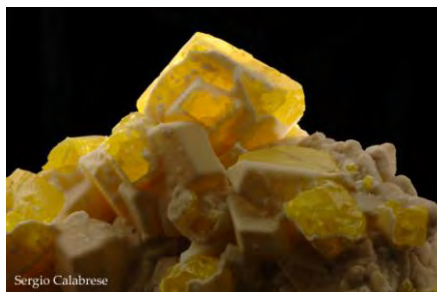
Geo & Geologia