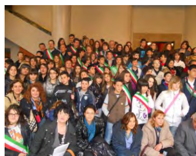
Geo & Educazione