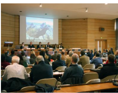
Geo & EGN/GGN

"Felicità è trovarsi con la natura, vederla, parlarle"