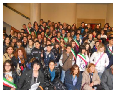
Geo & Educazione