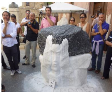
Geo & Arte