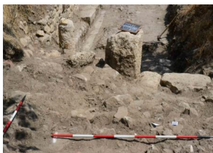
Geo & Cultura

(European & Global Geopark, con il supporto dell'UNESCO)