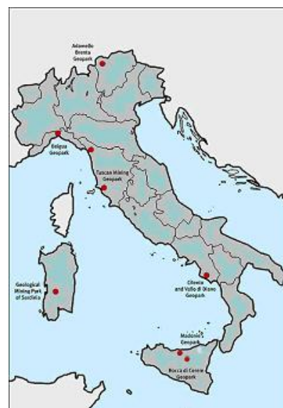
I Geoparchi in Italia