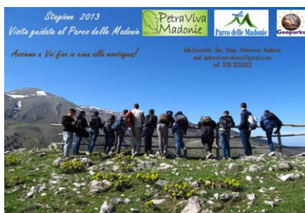
Geo & Geologia