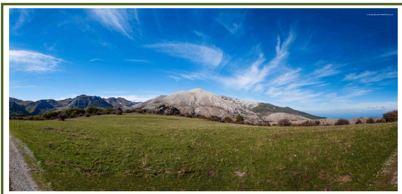
Il Parco delle Madonie, European & Global Geopark con il supporto dell'UNESCO