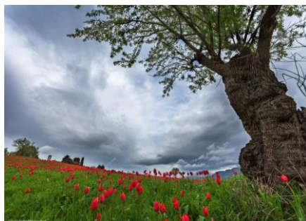
Geo & Natura